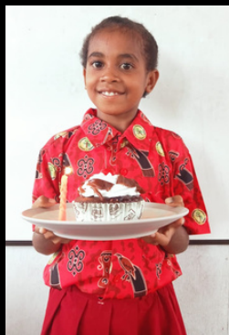
Perayaan Ultah Tahun