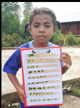
Belajar Berhitung Menggunakan Bahan Alam