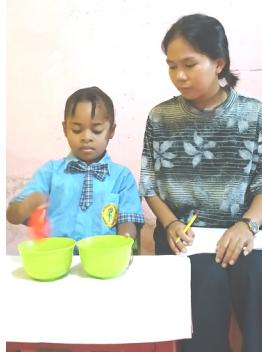
Montessori: Latihan Motorik Halus