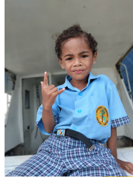
Nature Walk: Bermain di atas Speed