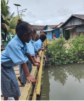
Nature Walk: Pengamatan Sungai