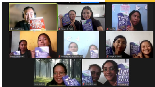
The 7 Habits of Highly Effective People oleh Freya Detiva