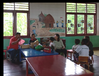
Pemeriksaan Kesehatan oleh TIm Dokter