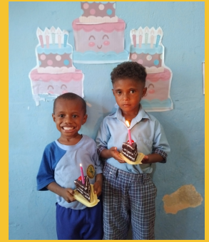
Perayaan Ulang Tahun