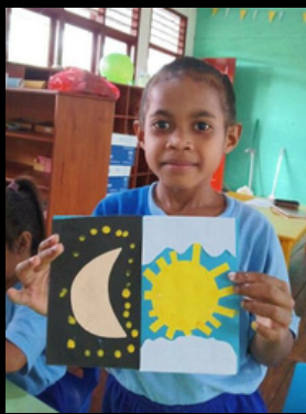
Belajar Penciptaan Hari ke-4